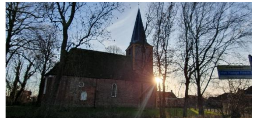
Torenkerk.

Daarna wordt er enkele malen stil gestaan voor een kort gedicht of een tekst. Alle deelnemers zijn vrij om tijdens dit rondje stil te zijn, te mijmeren of te praten met medelopers. Aan het “rondje” kan iedereen mee doen, aanmelden is niet nodig en het “rondje” gaat altijd door.