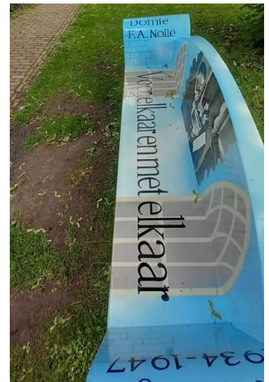
bank bij de Obergumerkerk

Daarna wordt er enkele malen stil gestaan voor een kort gedicht of een tekst. Alle deelnemers zijn vrij om tijdens dit rondje stil te zijn, te mijmeren of te praten met mede-lopers. Aan het “rondje” kan iedereen mee doen, aanmelden is niet nodig en het “rondje” gaat altijd door.