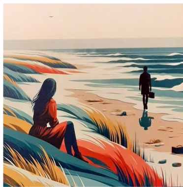
AI tekeningen van Jaap van der Stel

Vanaf 14.30 u bent u hartelijk welkom in de Centrumkerk. Om 15.00 u begint het programma. In de pauze is er een 'hapje' en een drankje. Einde programma is ong. 16.45 u. De toegang is gratis, een gift is welkom! Hartelijk welkom!