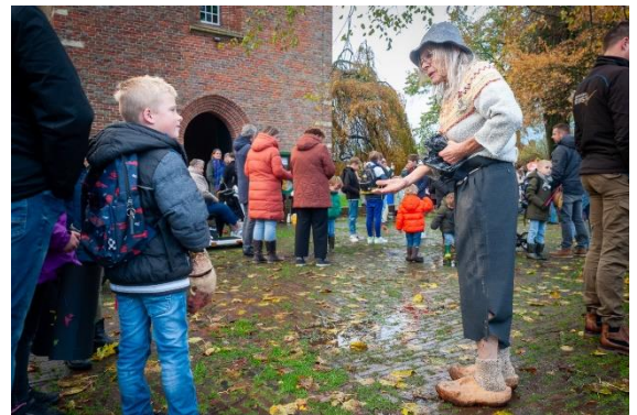
Foto: Sint Maarten viering in Eenrum 2023

De viering wordt georganiseerd door Kerk in het Dorp en jeugdwerk in samenwerking met de Nederlands Gereformeerde Kerk en de Rooms-katholieke kerk.