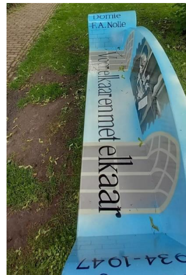
bank bij de Obergumerkerk

Iedere 3 e donderdag is er een “rondje om de Toren”, een bezinningswandeling van een klein uur, te beginnen bij de Torenkerk (19.30 uur) Kerkstraat 14 in Winsum en eindigend bij de Centrumkerk (20:30 uur) met als afsluiting koffie en thee en wat lekkers. De wandeling begint met een tekst/een gedicht waarna er ca. 10 minuten in stilte wordt gelopen. Daarna wordt er enkele malen stil gestaan voor een kort gedicht of een tekst. Alle deelnemers zijn vrij om tijdens dit rondje stil te zijn, te mijmeren of te praten met mede-lopers. Aan het “rondje” kan iedereen mee doen, aanmelden is niet nodig en het “rondje” gaat altijd door.