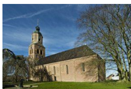
Auk Russchen (Eenrum)