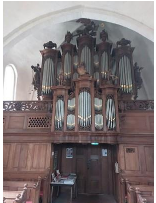
Het Lohman orgel in de kerk van Eenrum

Ik had een rot dag Heer, 't lukte niet best Ik werd door collega's Heer, ook nog gepest Het komt door het orgel Heer, door uw trompet Ik kwam haast ongemerkt door tot een gebed