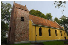
Agneta Evenhuis, (Westernieland)

In de kerken van Ronde Noord Groningen werken de volgende kunstenaars: